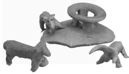
[그림3] 신라 토우-우형토기(牛形土器)

토기들은 종교용 및 제사용으로 쓰였을 것으로 추정되며 희생과 같은 성격을 지닌 것으로 보고 있다. 48) 이와 관련하여 『동국세시기』에는 관북지방에서는 입춘에 관가와 민가에서 나무로 된 소를 만들어 길에 내놓는 풍습